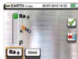
Earth resistance: selection of measurement type