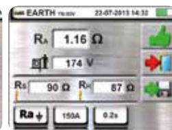
Earth resistance: result OK.