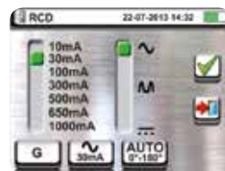
Selection of RCD type and tripping current