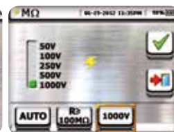
Selection of test voltage and minimum limit value on MQ measurement