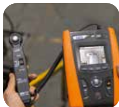
Lux measurement with