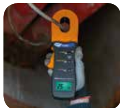
Earth resistance measurement