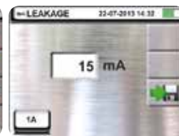
Leakage current with optional clamp 96U