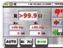
Continuity of protective conductors: Measurement result negative