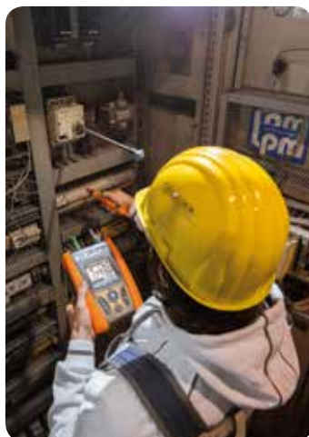
Start/stop measuring with remote lead