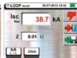
Advanced Loop: negative result of breaking capacity test.